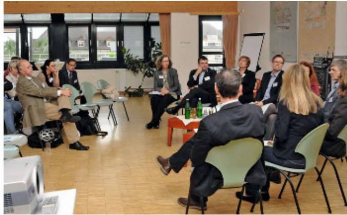
Abschlussdiskussion mit Referenten und Publikum