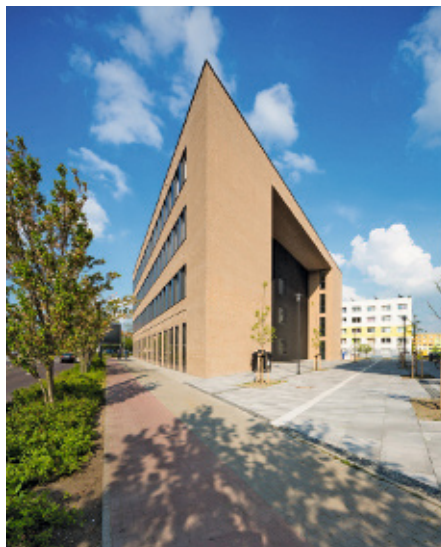
Gebäude 28

Die Arbeitsgruppen sind im Forschungsneubau Systembiologie (Gebäude 28) untergebracht. Der Forschungsneubau Systembiologie wurde im letzten Jahr eröffnet und beherbergt weitere interdisziplinäre Arbeitsgruppen des Zentrums für Dynamische Systeme. Systembiologie ist ein neues Wissenschaftsfeld und stellt eine Kombination aus experimenteller Forschung und theoretischer, mathematischer Modellierung mit Unterstützung von Computerberechnungen dar. Das Konzept des Forschungsgebäudes ist der intensive Austausch zwischen verschie-