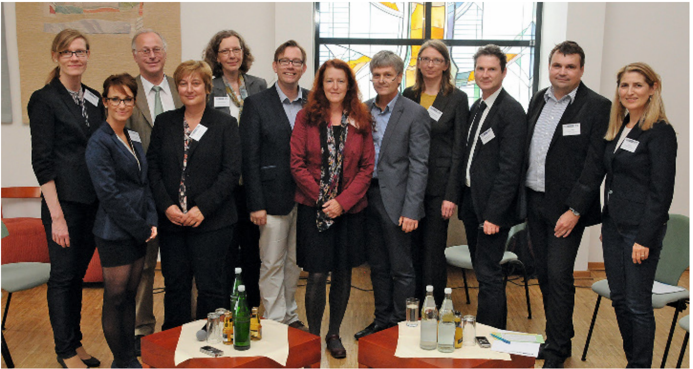
Die Referenten und das NEUROTRANS-Team